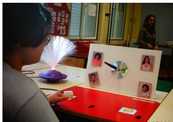
A Comunicação com sistema Pointer, construído na sala.

Temos vários recursos ao nível das Tecnologias de Inovação e Comunicação que fomos conseguido comprar e arranjar ao longo dos três anos da vida da Unidade, que são muito importantes no trabalho com os alunos, sendo o computador; o Boardmaker; a Escrita Criativa com Símbolos; o Invento. O Digitalizador de Voz tem sido um dos aparelhos mais usado como recurso de