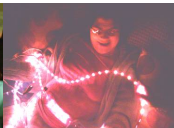
A estimulação em ambiente Snoezellen