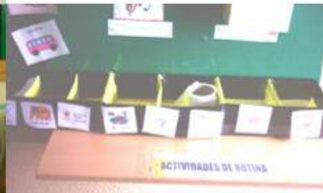
A estruturação temporal das rotinas (calendário)

A intervenção especializada individualizada e personalizada centradas nos alunos para desenvolver competências de comunicação, de socialização e de autonomia.